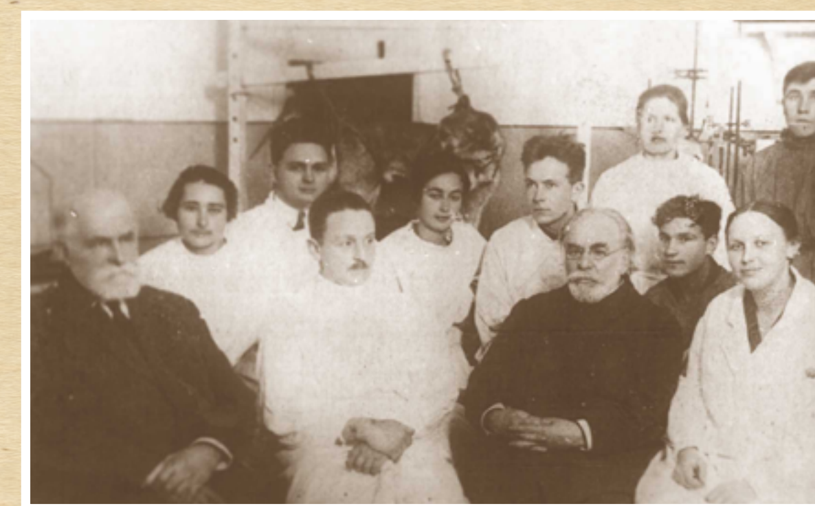
Зліва направо академіки І.П. Павлов, Г.В. Фольборт, В.Я. Данилевський, член-кор. АН УРСР Є.К. Приходькова в Органотерапевтичному інституті (1934)