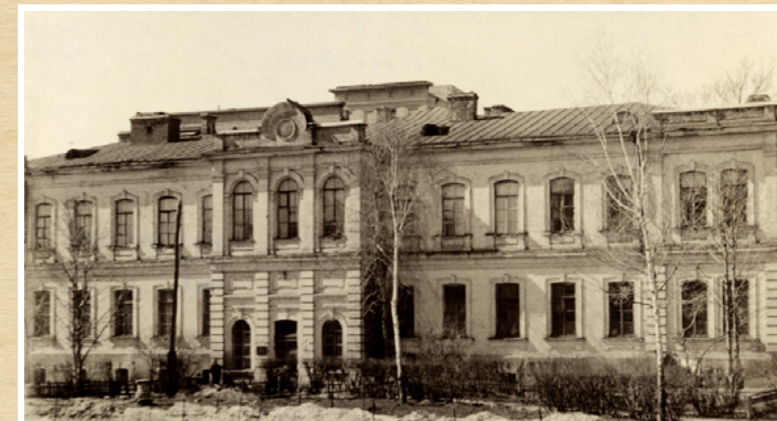
Будівля анатомічного театру Харківського університету (1887). Нині, каф. нормальної анатомії