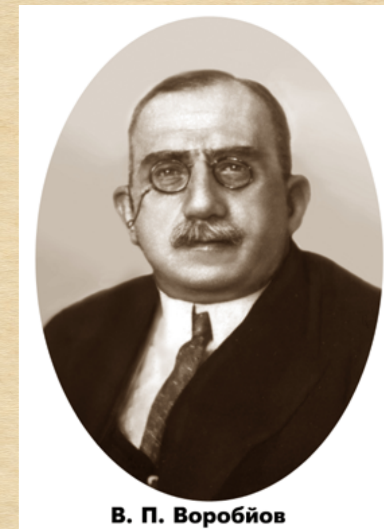
В. П. Воробйов

Ім'я В.П. Воробйова живе в його працях, його носять вулиця й провулок в м. Харкові, а також морфологічний корпус Харківського національного медичного університету. На подвір'ї університету встановлено пам'ятник вченому.