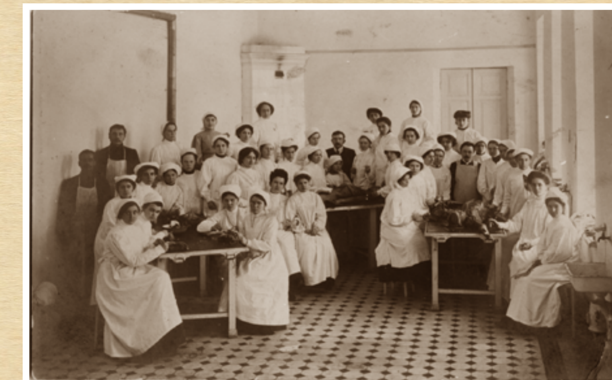
Професор В.П. Воробйов (стоїть у центрі) серед студенток Жіночого медичного інституту (1913)