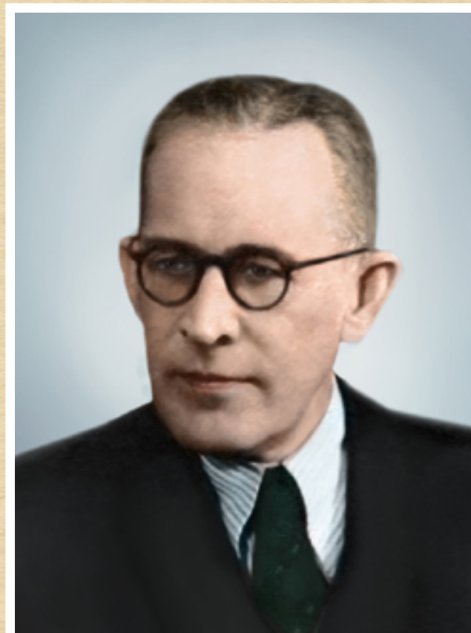
М.М. Бокаріус (1899–1966)

Вічна пам'ять про видатних харків'ян — членів сім'ї Бокаріус, які здійснили великий внесок у розвиток вітчизняної судової експертизи та криміналістики, дозволяє на їх прикладі виховувати молоді покоління судових експертів та викликає почуття гордості за нашу країну і любов до її талановитих людей.