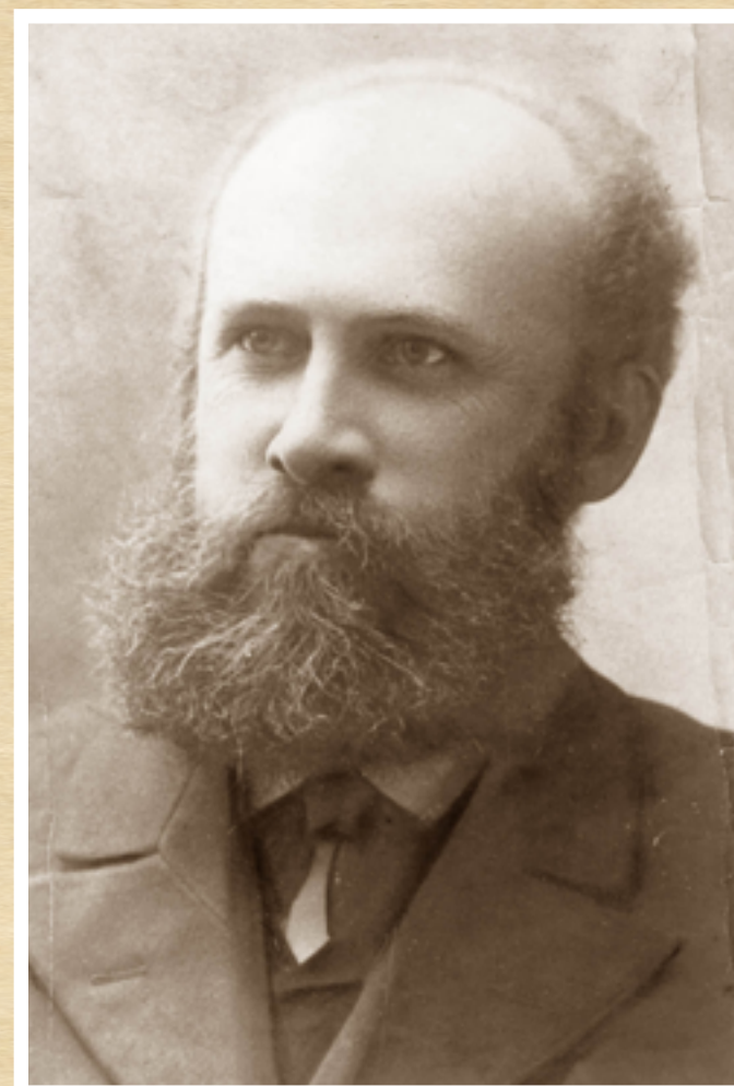
М.С. Бокаріус, 1908

Микола Сергійович працював до останніх днів свого життя. 23 грудня 1931 р., після тяжкої хвороби М.С. Бокаріус помер. Відзначаючи вагомий внесок Миколи Сергійовича Бокаріуса в розвиток судової експертизи, його ім'я було присвоєно Харківському науково-дослідному інституту судових експертиз, організатором і першим директором якого він був з дня його заснування.