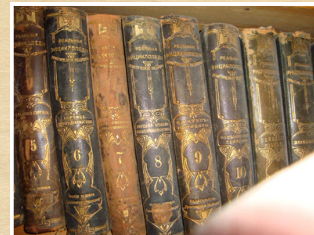
Книги з фонду ХНМБ