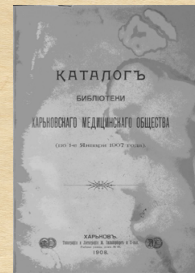
Каталог библиотеки ХМО (1 стр.)

Лікар без використання книг, журналів, інформаційних видань не може відбутися як спеціаліст. Для розвитку наукової та практичної медицини необхідне використання всього комплексу знань і досягнень людства, відображеного на сторінках книг, журналів, наукових праць. Бібліотека — це безцінне невичерпне джерело цих знань і тому, за радянських часів, згідно з рішенням Державного комітету СРСР з науки і техніки ХНМБ — єдина з медичних бібліотек України — була включена в Перелік наукових і науково-технічних бібліотек, що мають історично накопичені фонди великої наукової та культурної цінності ... ».