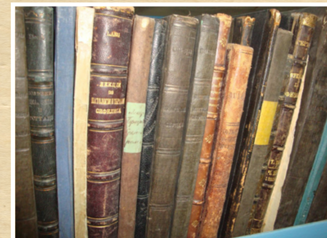
У книгосховищі ХНМБ на вул. Пушкінській, 14