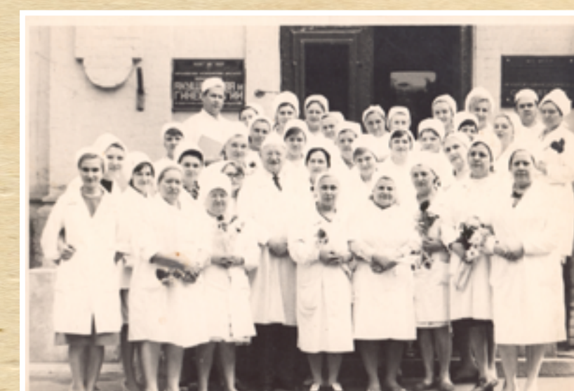
Кафедра акушерства і гінекології № 2 ХМІ, 1979