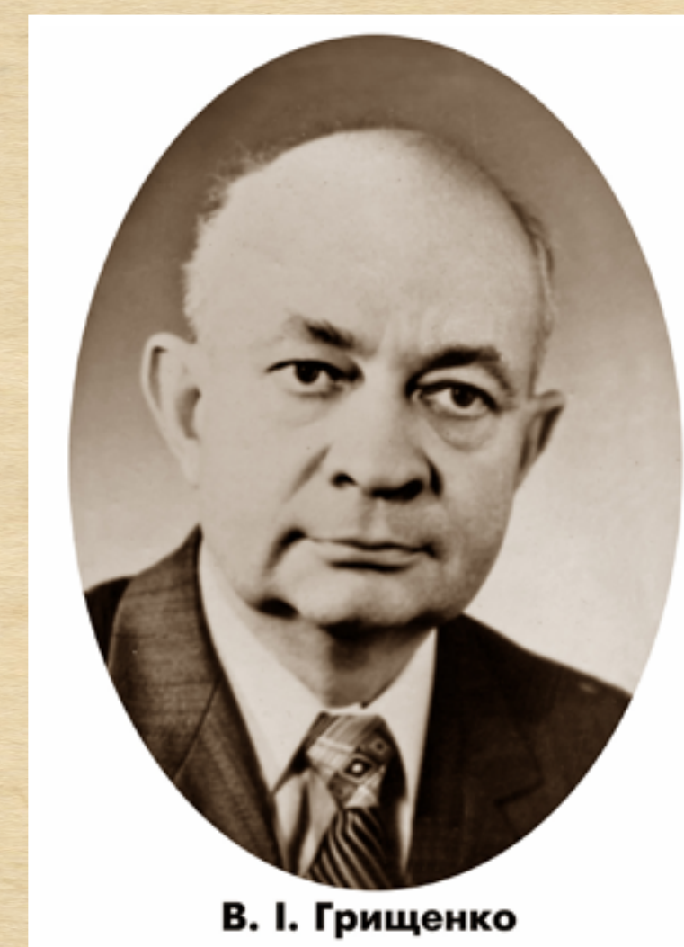
В. І. Грищенко