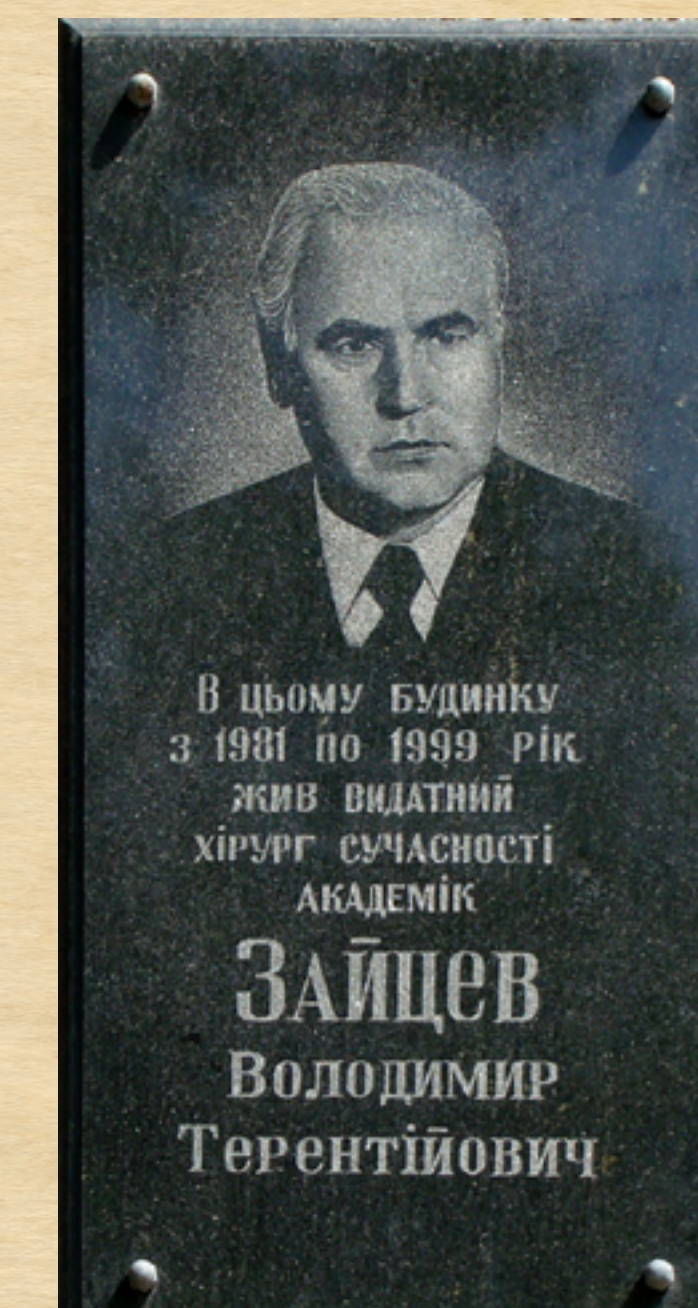
Мемориальная доска В.Т. Зайцеву