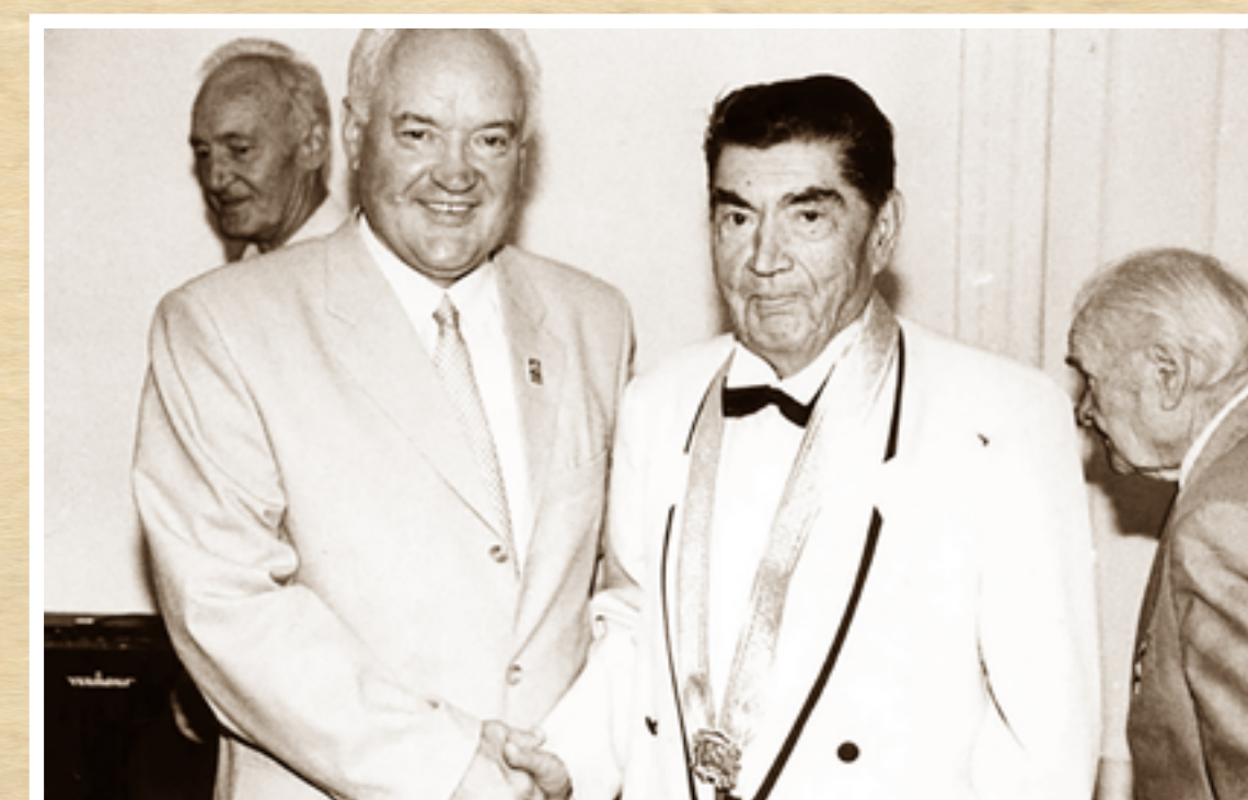
М.Д. Пилипчук и А.А. Шалимов — Почётные граждане г.Харькова