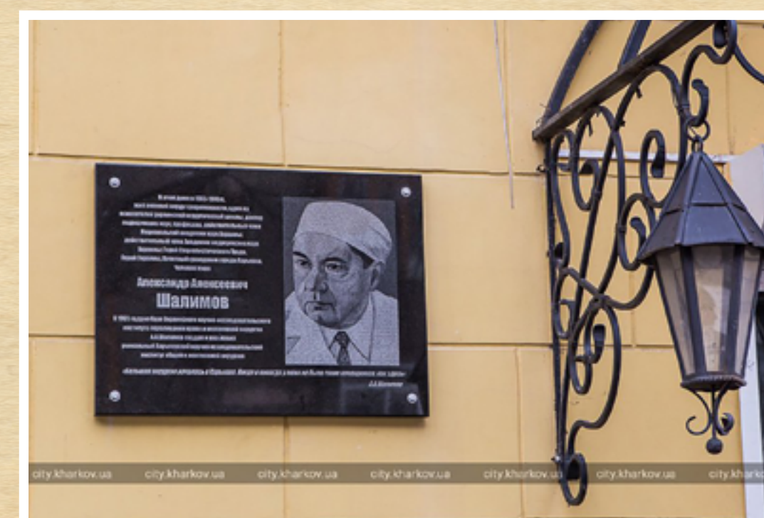
Мемориальная доска А.А. Шалимову