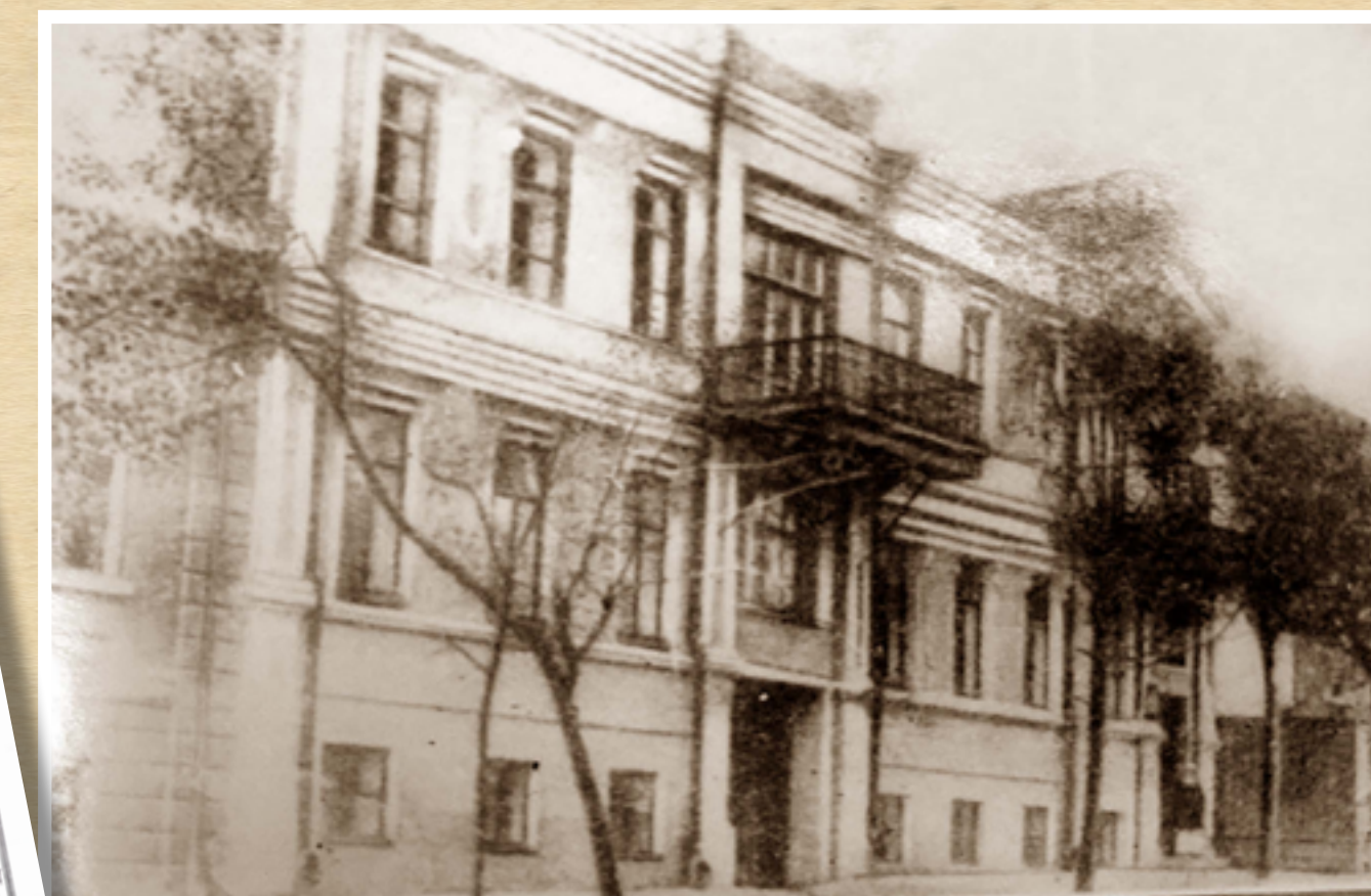
Клініка проф. Трінклера на вул. Чернишевській