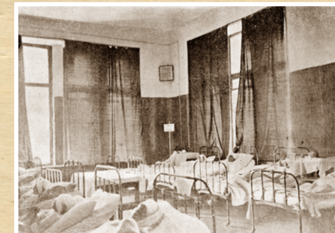
Глазная больница. Общая палата