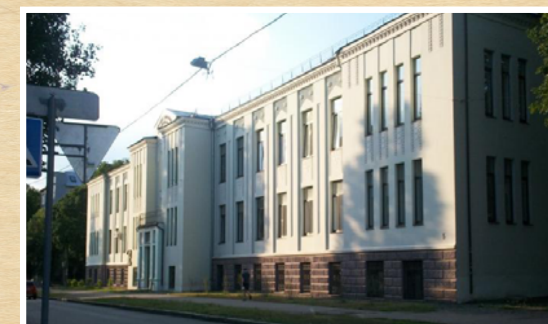
Офтальмологическая клиника им.Гиршмана сейчас