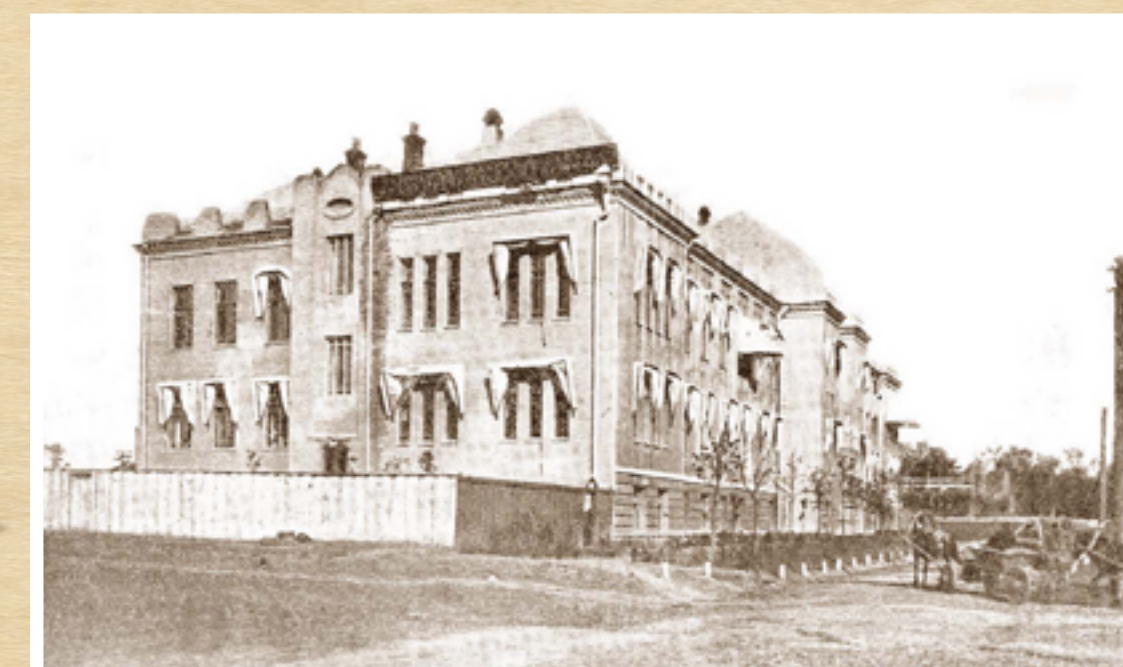
Глазная больница им.Гиршмана в Нагорном районе