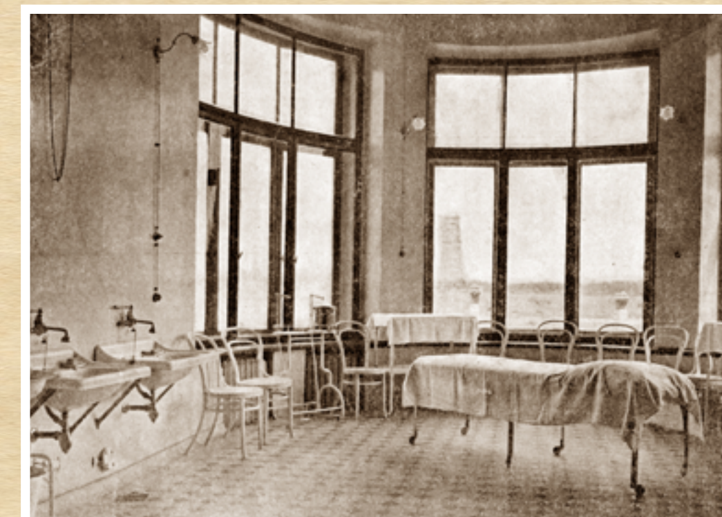
Глазная больница. Операционная