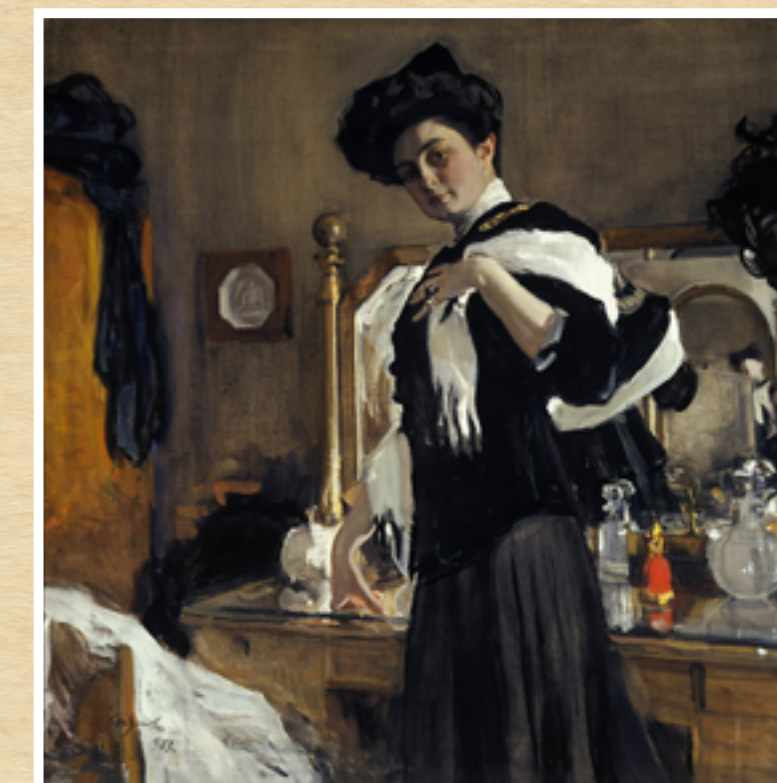
Валентин Серов «Портрет Г.Л. Гиршман», супруги Л.Л. Гиршмана